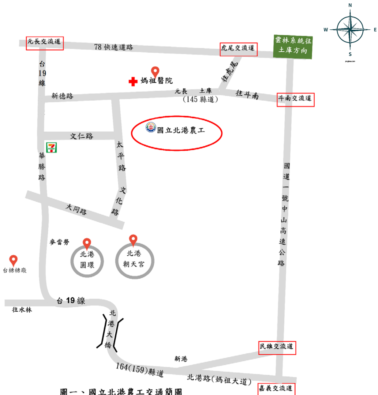
圖一、國立北港農工交通簡圖

國道一號北上，下嘉義交流道，朝新港／北港方向走北港路／159 縣道，走到底接縣道 164 號，順著走進入台 19 線往北港，下北港大橋直接左轉繼續走華勝路/台 19 線走 1.7 公里後右轉文仁路，直行到底即可到達北港農工。